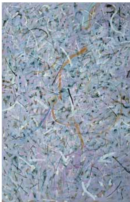
Soós Tamás - Szubsztanciák III. 1982-83; karton, tempera; 200×130 cm