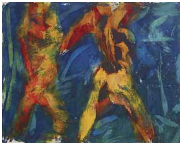
Franz Grabmayr - Tánc; 1975; szövetfesték, molinó; 140×181 cm

VÍZIVÁROSI GALÉRIA 1027 Budapest II. Kapás utca 55. Telefon: 201 6925