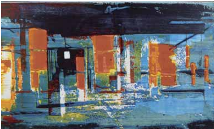
Korodi János – NF4 – Naplemente; 2003; vegyes technika, vászon; 105×160 cm

NYITVA TARTÁS: keddtől-péntekig 13-18 óráig; szombaton 10-14 óráig