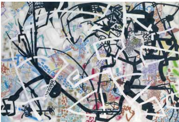
Szirtes János – Montezuma; 1987; vászon, akril; 100×140 cm