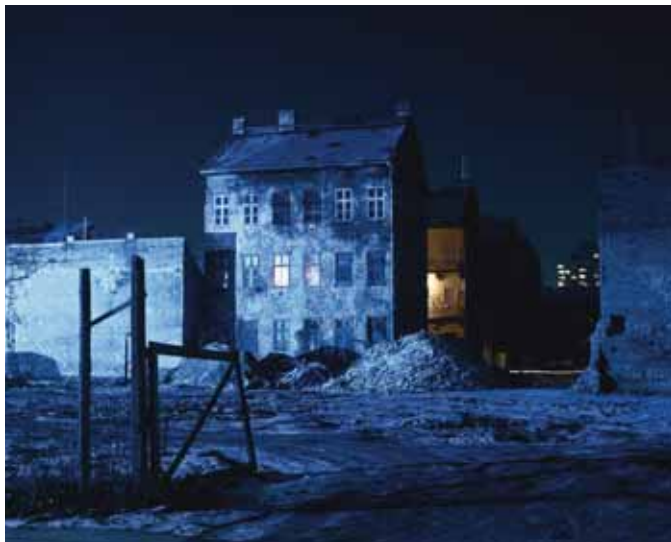
Kudász Gábor Arion – Bérház; 2008; fotó; 2008; 84×100 cm

(idézet a Szép Gyűjtemény katalógusából)