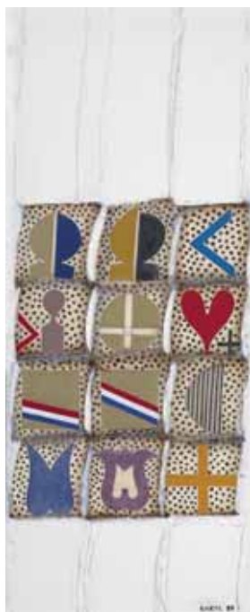
Bartl József - Fejek és formák; 1989; olaj, vászon; 100×40 cm